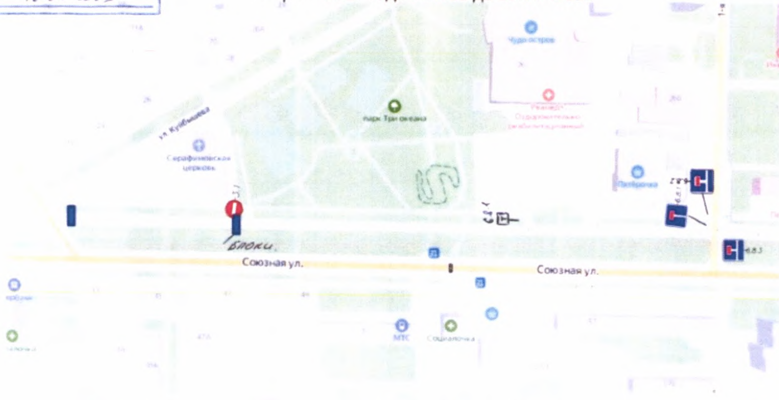
Схема временного ограничения движения (участка дублёра) ул. Союзная на время проведения пасхальных мероприятий 04 мая 2024 года с 09:00 до 19:00 часов

Приложение к Постановлению «...» _____ 2024 года